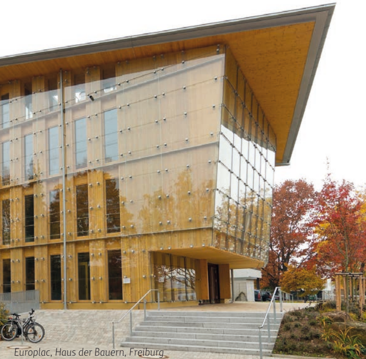
Europlac, Haus der Bauern, Freiburg

Stellen Sie Furniere her? Handeln Sie mit Furnier? Verarbeiten Sie Furnier oder stellen Sie furnierte Produkte her? Sind Sie Hersteller von Trägermaterialien? Dann sind Sie unser Partner! Werden Sie Teil einer kleinen, aber feinen Familie. Furnier ist das Edelste, was man aus Holz herstellen kann. Lassen Sie uns das Image von Furnier gemeinsam aufpolieren und diesen wunderbaren Werkstoff zu dem machen, was er ist: nachhaltig, wertvoll, einzigartig. Hier lesen Sie, was alles für Ihre Mitgliedschaft spricht: