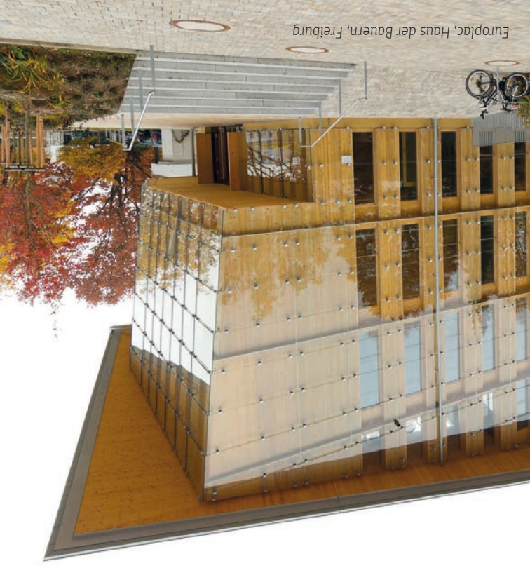
Europalac, Haus der Bauern, Freiburg

Do you produce veneers? Do you trade in veneer? Do you use veneer or do you produce veneered products? Are you a manufacturer of substrate or core materials? Then you are our partner! Become part of a small, but fine family. Veneer is the finest thing that can be made from wood. Let us spruce up the image of veneer together and make this wonderful material be seen for what it is: sustainable, valuable, unique. Here you can read about why you should become a member: