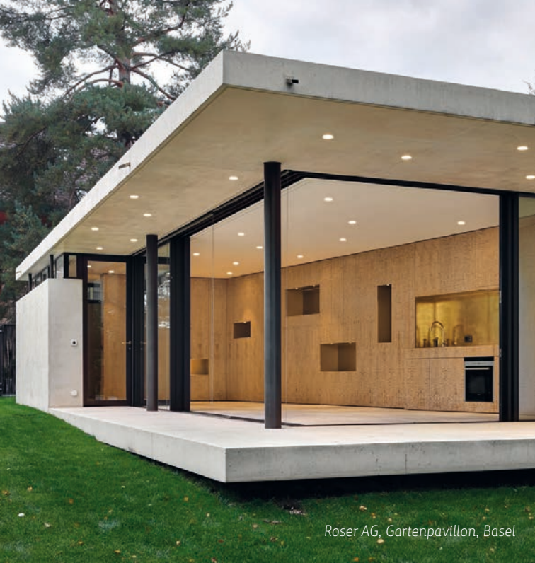
Roser AG, Gartenpavillon, Basel